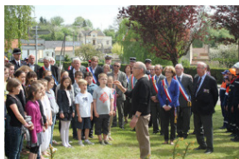
Commemoration Armistice, organisée par les anciens combattants et le souvenir français en partenariat avec la commune et les enfants de l'école, le 8 mai