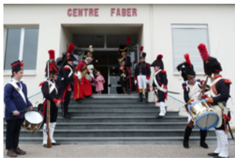
Exposition Empire Napoléonien - images d'Epinal, figurines et soldats de plomb - organisée par la commune les 20 et 21 avril