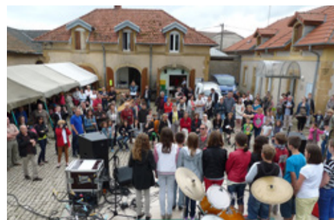
Fête de la musique le 21 juin