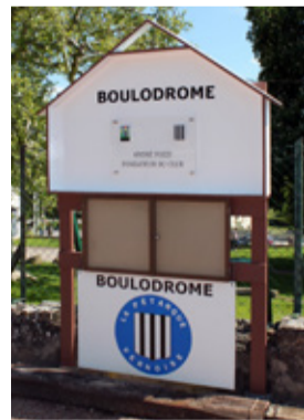
Inauguration du boulodrome le 5 mai, en hommage à André Pozzi, fondateur de la Pétanque vernoise